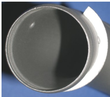
边缘和缺口部分保护效果良好