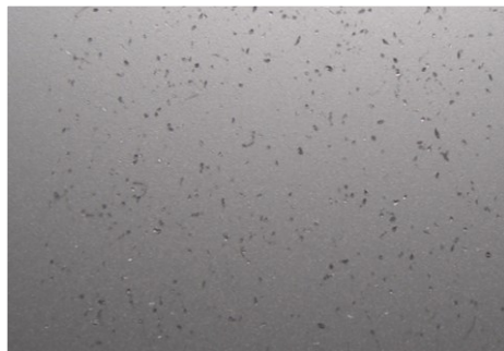
耐室外曝露实验性能佳